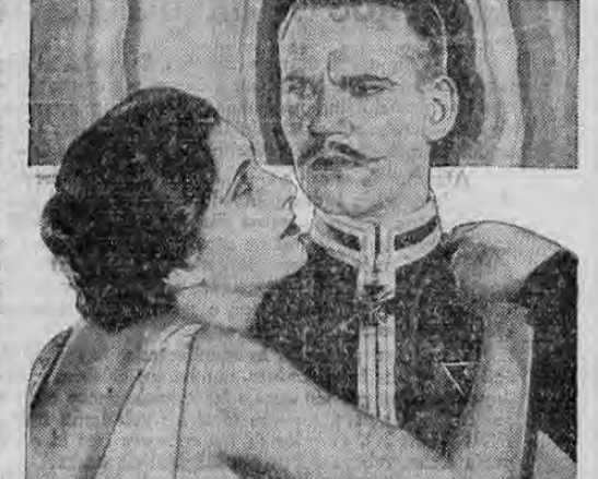
Walter Huston, Kay Francis in a scene from the Paramount Picture "The Virtuous Sin". With Kenneth MacKenna

HOY, EN EL RAVENTOS, "EL PECADO VIRTUOSO", POR WALTER HUSTON Y KAY FRANCIS